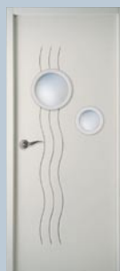
Moderna Cascade 2 Bulles