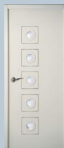
Moderna Cubisme 5 Bulles