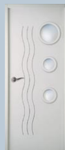
Moderna Cascade 3 Bulles