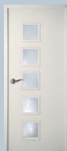
Moderna Cubisme 5 Dés