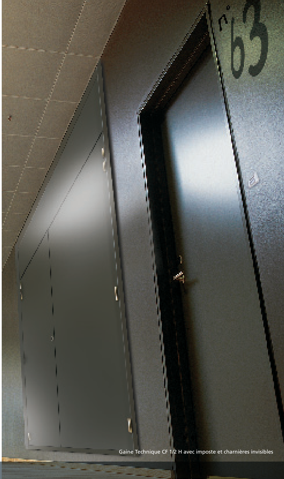
Gaine Technique CF 1/2 H avec imposte et charnières invisibles