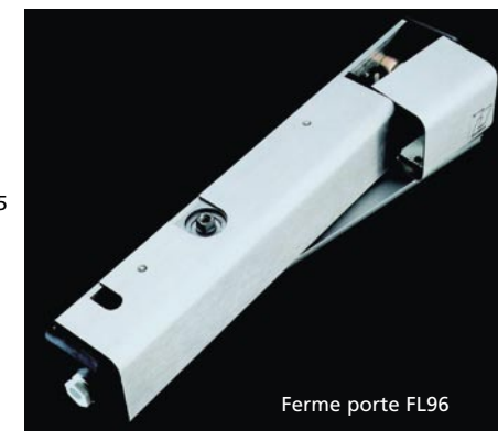
Ferme porte FL96