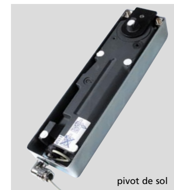
pivot de sol