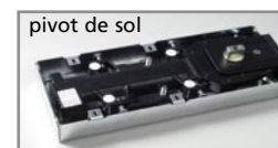
pivot de sol