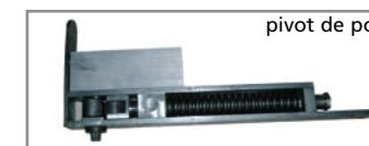
pivot de porte