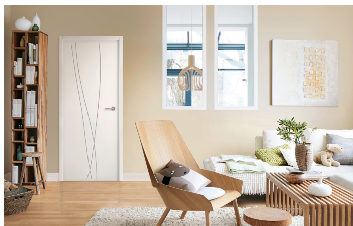
Porte rainurée Groove COSMO (disponible en porte acoustique, isolante et porte coulissante)

La porte coulissante se montre à la fois esthétique et pratique. Aujourd'hui très prisée par les architectes d'intérieur, elle équipe beaucoup de nouveaux logements. Avec son absence de débattement, la porte coulissante permet de gagner de la superficie au sol (environ 1 m 2 d'espace disponible) et d'optimiser l'aménagement intérieur, y compris dans les pièces les plus étroites. Disponible en applique sur un rail coulissant (la porte glisse devant la cloison) ou en châssis à galandage : la porte glisse à l'intérieur de la cloison et tout son mécanisme est totalement invisible. La porte est disponible avec l'habillage de la cloison assorti.