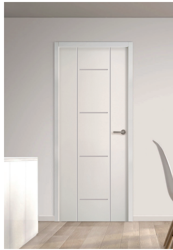
Porte acoustique rainurée Groove SCALA