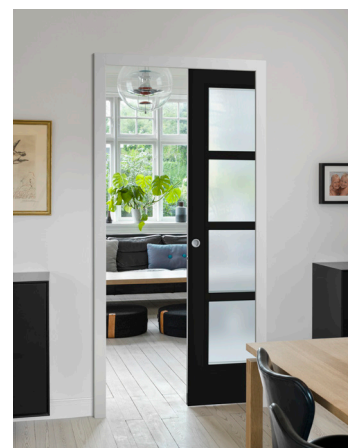
Porte coulissante plane vitrée TOSCANE sur châssis coulissant à galandage

Disponible en : Décor, stratifiée, laquée blanc, ou rainurée ou postformée finition à peindre pour un laisser libre cours à toutes les envies de décorations... 1 ou 2 vantaux