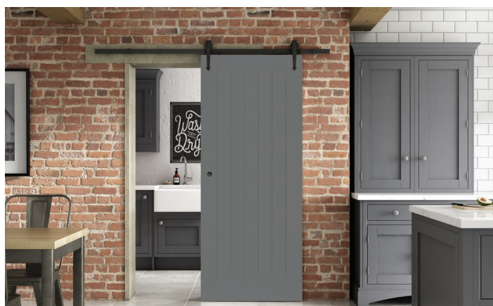
Porte coulissante postformée COUNTRY sur rail en applique