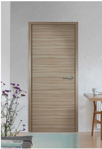
Porte acoustique Décor HAVANE