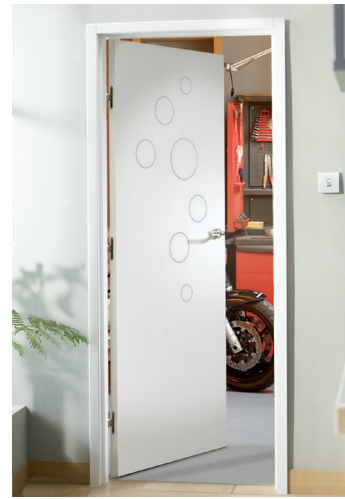
Porte isolante rainurée Groove PÉTILLE