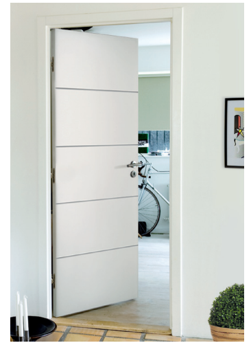
Porte isolante postformée HORIZON