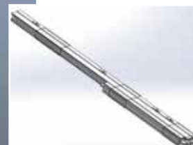
Huisserie bottelée (2 vantaux)

JELD-WEN prend un engagement fort et s'inscrit dans une démarche d'accompagnement des artisans et professionnels du bâtiment en leur proposant des solutions pour palier aux contraintes des chantiers.