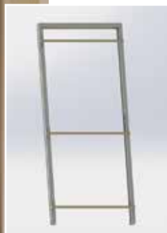
Huisserie écharpée (1 vantail)